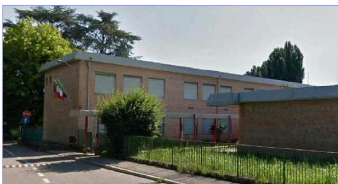
Plesso "E. Fermi" via Restara 2