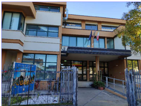
Sede centrale via Borgofuro 6