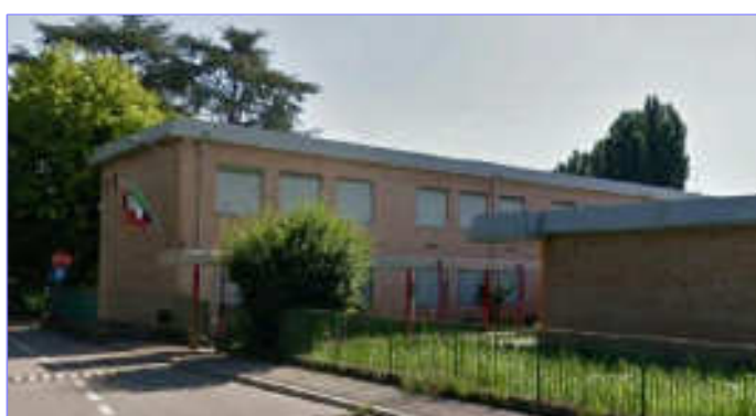
Plesso "E. Fermi" via Restara 2