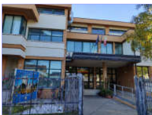
Sede centrale via Borgofuro 6

In assenza di personale sanitario o non sanitario formato, nei casi di sospetto arresto cardiaco è comunque consentito l'uso del defibrillatore semi-automatico o automatico (DAE) anche a chi non sia in possesso dei relativi requisiti. Per dette persone si applica l'art. 54 del C.P. (esclusione di responsabilità).